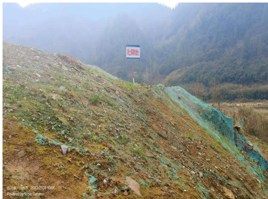
表土剥离堆存苫盖并播撒草籽